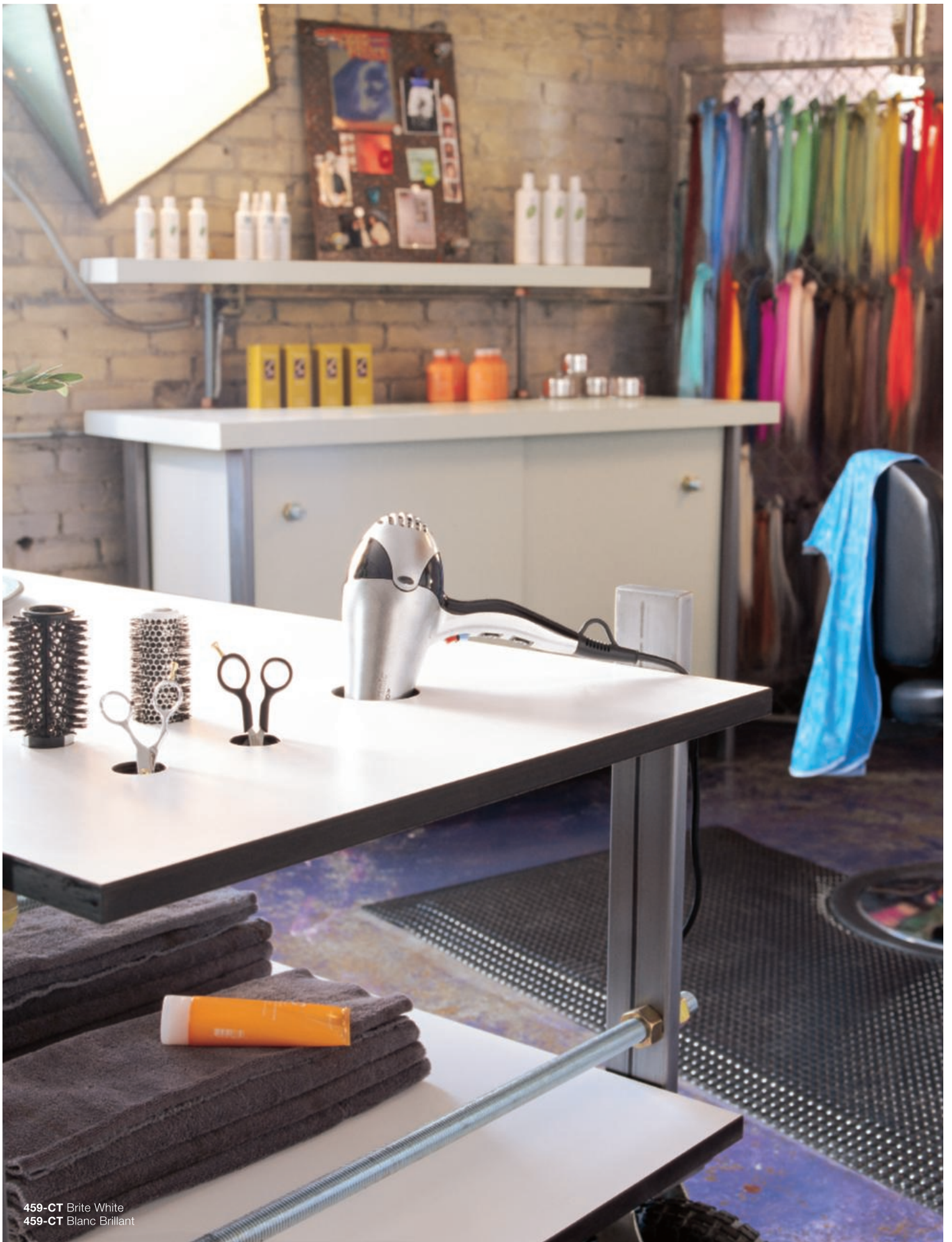
459-CT Brite White 459-CT Blanc Brillant