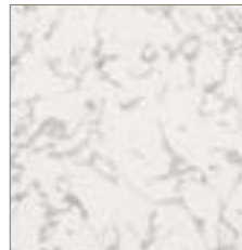
70103 Cheyenne Gray Gris Cheyenne