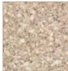
3517 Sand Crystall Cristal de Sable