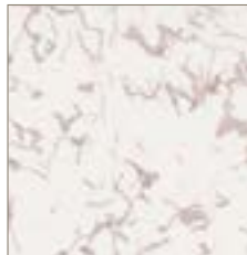
70101 Grey Concord Gris Concord