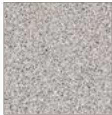
503 Stone Grafix Grafix Pierre

Accès aux revêtements de sol est d'un aspect attrayant, facile d'entretien et résistant aux taches, aux marques et à l'abrasion Il est conforme aux exigences relatives à la génération de brouillage statique faible et de conservation.