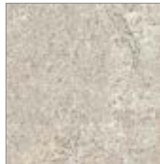
7267 Concrete Stone Pierre Mortier