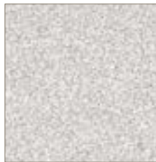
507 Folkstone Grafix Grafix Grès