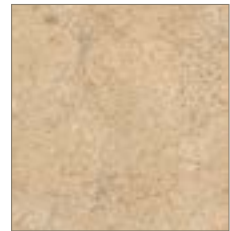
7265 Sand Stone Pierre Grès

These images are printed representations of the colors and finishes. Please view an actual sample prior to making your final selection.