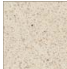
6729 Paloma Bisque Paloma Bisque