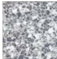
3518 Flint Crystall Cristal de Silex