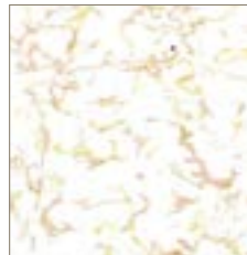
70102 Beige Concord Beige Concord