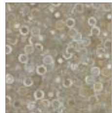
3698 Beluga Beige Béluga Beige